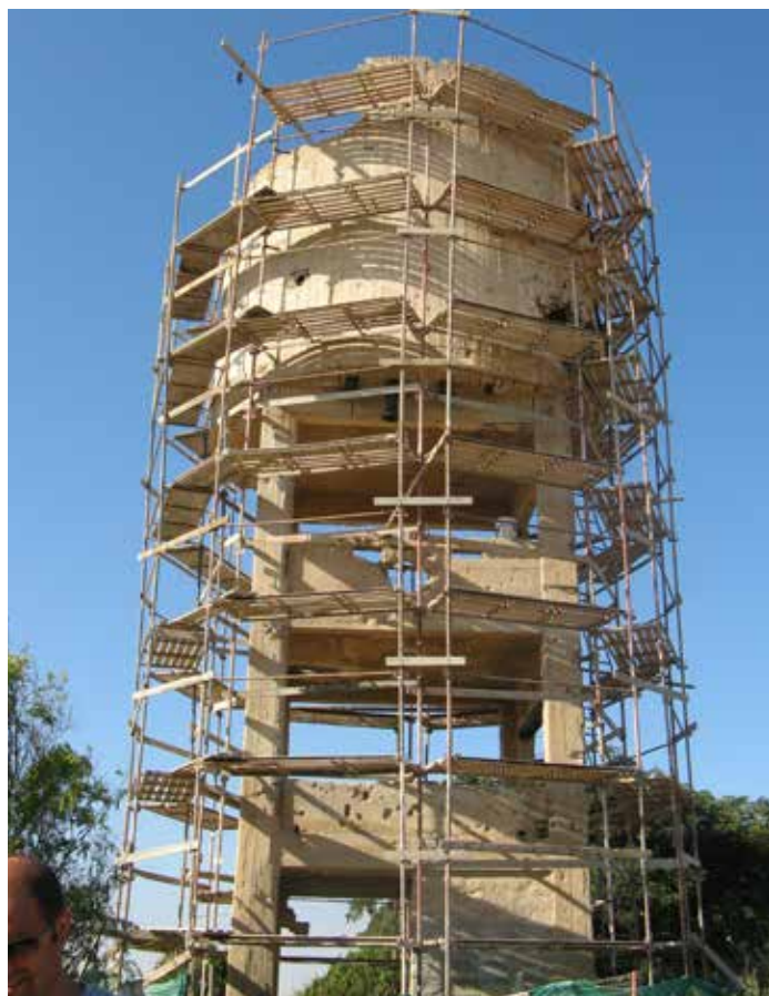
מגדל המים בבארות יצחק במהלך השימור ואחריו.