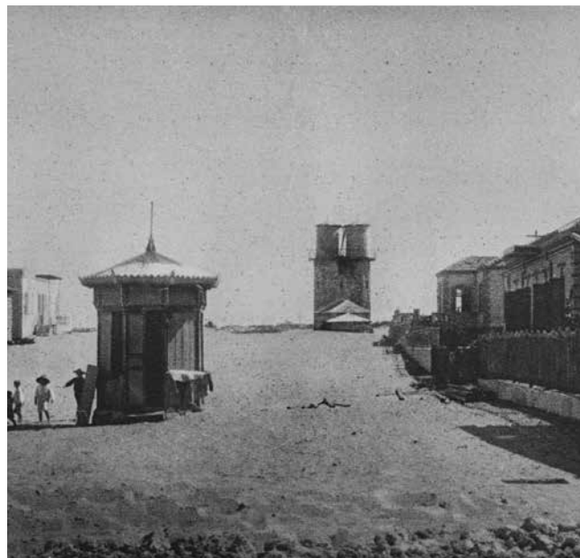
מגדל המים בשדרות רוטשילד, 1910.

של מערכת אספקת המים ביישוב, חדל המבנה לשרת את המטרה שלשמה נועד. בשנת 1989 פנה ראש עיריית חיפה לוועד קריית חיים בדרישה לשפץ את המבנה המתמוטט או להרוס אותו מכיוון שהוא מהווה סכנה בטיחותית. לאור ההערכה כי השיפוץ יהיה יקר החליט הוועד בשנת 1991 על הריסת המבנה. ההחלטה נתקלה בהתנגדות של תושבים ותיקים ושל המועצה לשימור אתרים. לאחר שורה של צעדים משפטיים הוחלט לדחות את ההריסה כדי לאפשר גיוס כספים לשיפוץ המבנה. במודעה שהתפרסמה בעיתונות הארצית נקראו תושבי קריית חיים בעבר ובהווה לתרום כסף לשיקום מגדל המים, בנימוק שהמבנה הוא בעל ערך היסטורי ולאומי ומסמל את ראשית ההתיישבות במפרץ חיפה. הלחץ הציבורי הביא לשינוי עמדתו של ועד הקריה, ובשלהי דצמבר 1993 הוא פרסם הודעה מטעמו ובה העלה על נס את ערכו ההיסטורי והצינוני של המגדל.