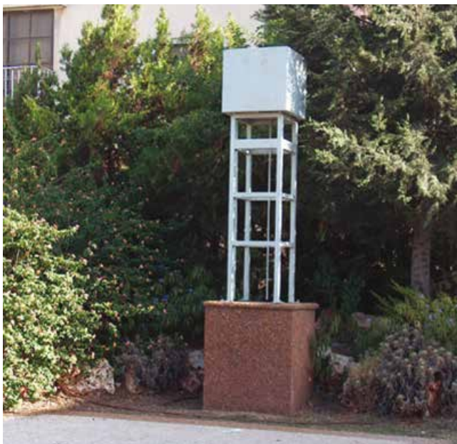
קריית חיים - מודל של מגדל המים ניצב ב"גן המגדל", במקום שבו שכנ המגדל שנהרס.