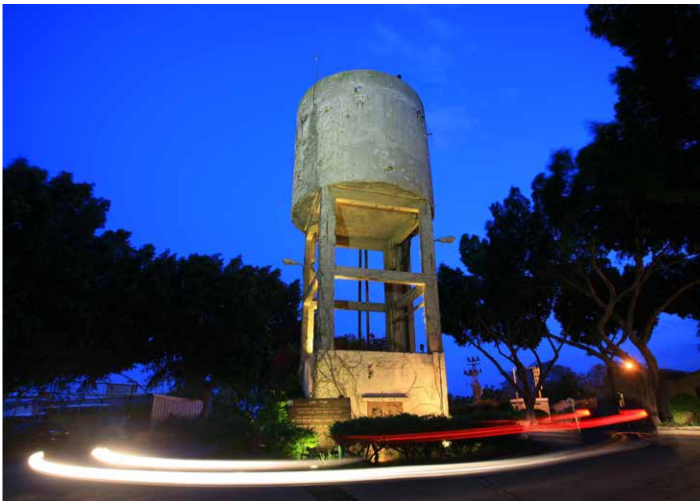
מגדל המים בנגבה.

ומפלתו של האויב. בפינה שעל יד חדר האוכל נורתה כבר אבן הפינה לבריכה החדשה [...] יש להניח שתוך שלושה חדשים, שוב יזרמו המים ברשת הצינורות שבכל הפינות. 2