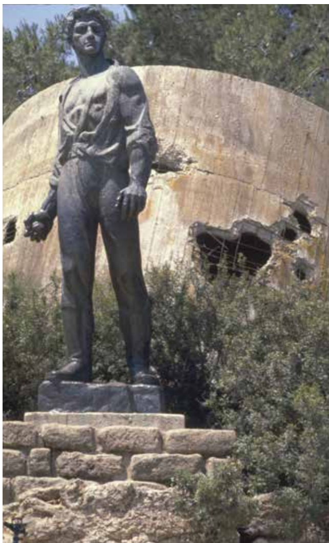
מגדל המים ביד מרדכי. צילום: יעקב סער, לע"מ, 1989