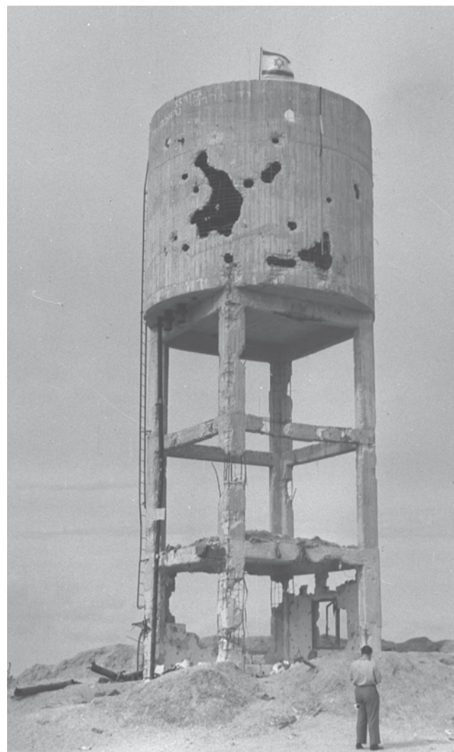
מגדל המים ביד מרדכי. צילום: דוד אלדן, 1948, לע"מ

הפיכתם של מגדלי המים למצבות זיכרון לא דרשה מאמצים או השקעה כספית בקנה מידה גדול, אך האפקט שהיה לכך על נוף הזיכרון המקומי היה מידי ודרמטי. תלמיד תיכון שביקר עם כיתתו בנגבה ב-1957 כתב בעלון בית ספר על רשמיו מהטיול, שבמהלכו הראתה המורה לתלמידים "את מגדל המים המפוצץ שהשאירוהו למזכרת ממלחמת השחרור". תלמיד תיכון שביקר עם כיתתו ביד מרדכי ב-1953 כתב על רשמיו מהביקור: