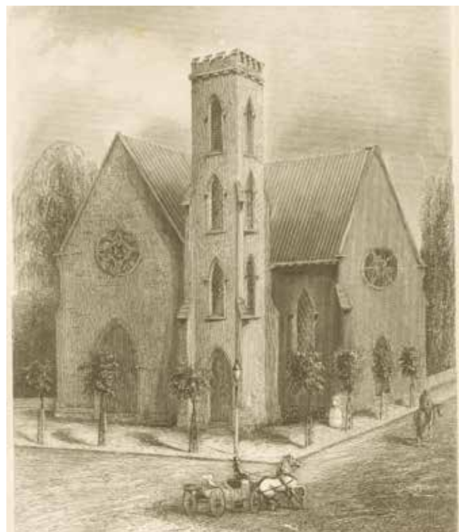
איור של מתחם הכנסייה מסוף המאה ה-19. The Miriam and Ira D. Wallach Division of Art, Prints and Photographs: Print Collection, The New York Public Library. "Church of the Holy Communion" New York Public Library Digital Collections. Accessed April 24, 2016. http://digitalcollections.nypl.org/items/510d47da-27df-a3d9-e040-e00a18064a99

בית חדש במקום אחר (Church not to move, 1907). ואכן תהליך זה התרחש, ובמהלך שנות השבעים של המאה ה-20 הצטמצמה קהילת המתפללים עד למיזוגה עם שתי כנסיות אחרות בעיר. בשנת 1976, לאחר שנערכה המיסה האחרונה, עברו המבנים במתחם הכנסייה תהליך של חילוץ והסרת הקדושה (Pulos, 2015). מאז ועד היום עבר המבנה כמה תהליכי הסבה לשימושים שונים, רובם ככולם בעלי אופי מסחרי. בשנים 1976-1979 החכירה אותו הכנסייה לאגודה פרטית שעסקה בתרבות ובהגות. בשנת 1979 הוא נמכר לעמותת פרטית שהפעילה בו מרכז לייעוץ ולגמילה מסמים. בראשית שנות השמונים נמכר הנכס שוב, ולמשך שני עשורים פעל במבנה מועדון לילה בשם The Limelight - שהיה ממובילי סצנת חיי הלילה בניו יורק. במסגרת זו חולק החלל לשלושה מפלסים, ולחללים בכל מפלס נקבעו תפקודים שונים. בשנות התשעים היה המועדון ממובילי תרבות הרייב והמוזיקה האלקטרונית וזוהה עם הוללות, מסיבות פרועות וסמים, ולעתים קרובות נעלה המשטרה את דלתותיו. המועדון הפך ל"סמל" למאבקו של ראש עיריית ניו יורק רודולף ג'וליאני במועדוני הלילה ובסמים, עד שנסגר בשנת 1996 (Hughes, 2010; Matos, 2011). בשנים אלה עלה סיפור הכנסייה לכותרות והיא כונתה בהתרגם "The Church Of Rave". שמו של המועדון הוא עד היום שם נרדף למתחם הכנסייה לשעבר. בשנת 2001 החליף הנכס ידיים שוב ונמכר לקבוצת יזמים, וזו הקימה בו בהשקעת ענק מרכז חנויות יוקרתי בשם The Limelight Marketplace. בפעולות השיפוץ וההסבה נעשה מאמץ גדול להתנתק מהתדמית ההוללת שדבקה במקום, ועם זאת לשמור על מראהו של אולם המרכזי של הכנסייה (Hughes, 2010).