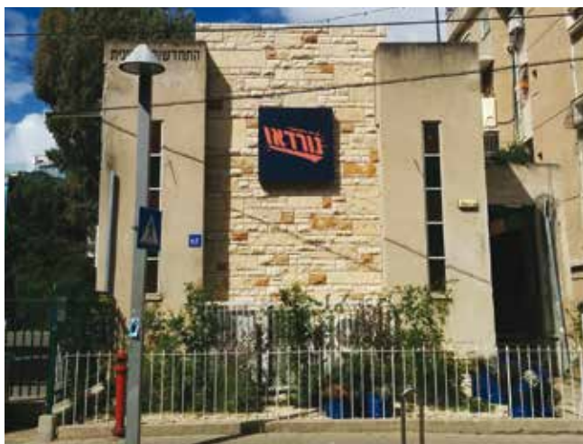
חזית בית הכנסת "חסידי גור א" בשדרות נורדאו 65, תל אביב.

השטיבל בנורדאו היה מוקד רוחני בשכונה. התפללו בו ראשי ישיבות, מקובלים, חסידים ואנשי מעשה. הוא היה לא רק מקום תפילה אלא גם מקום מפגש חברתי, והתאפיין ביחס אישי א-פורמלי והרגשה של משפחתיות (צ'רני ומייזליש, 2008). בימיו הטובים ידע בית הכנסת "צפיפות ודוחק מרוב המיית הבאים בשעריו, ובין שעריו התלכדו אנשי עמל, אברכים ובחורי ישיבות ממיטב סלתה ושמנה של החסידות" (נתנאל, 11.10.2015).