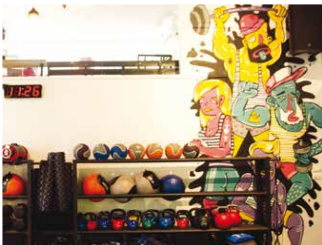
מבט לעבר קיר שעוצב על-ידי אמן גרפיטי ומאחוריו אזור עזרת הנשים לשעבר.