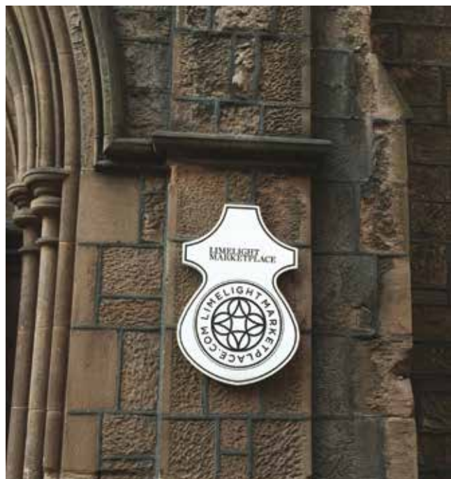
שמו של המועדון הילה The Limelight מסמך עד היום שמו של סתח הכנסייה לשעבר.

5. השיח הציבורי: שני המבנים עמדו במרכזו של שיח ציבורי שנסב סביב המאפיינים של השימוש החדש. על מבנה הכנסייה התפתח שיח מקטרג לאחר שהוסב למועדון לילה והתפרסם במסיבות