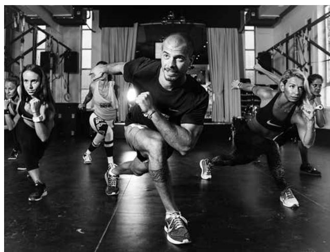
אימון כושר. ברקע בימת ארון הקודש שהוסבה לבימת המאמן.

חלק ממתחם עירוני דתי הכולל מבנים נוספים, ובהם בית הכומר ומגורי נזירות. המבנים תוכננו על-ידי האדריכל ריצ'רד מ' אפג'ון (Upjohn, 1802-1878), שהיה הנשיא הראשון של ארגון האדריכלים האמריקני (American Institute of Architects, AIA) והאדריכל של כנסיית השילוש הקדוש (Trinity Church) במנהטן.