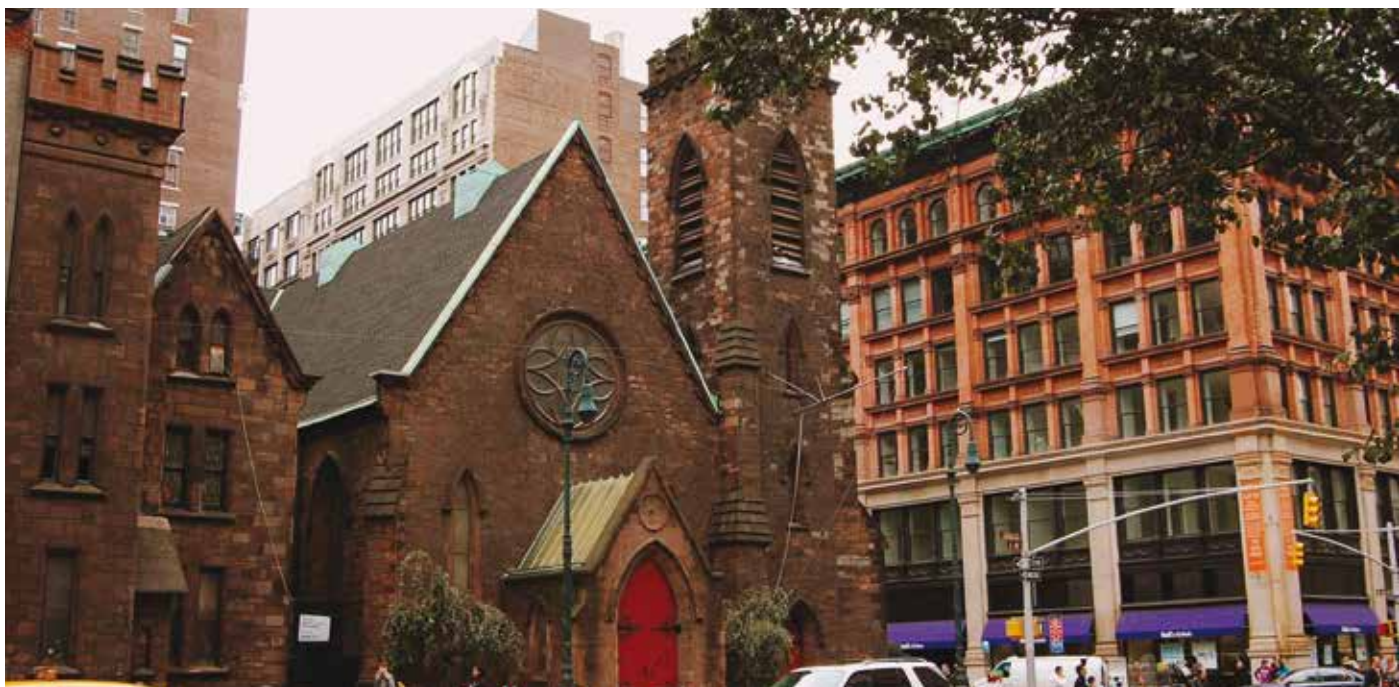
untappedcities.com. By Michelle Young במנהטן. Church of the Holy Communion

בית חדש במקום אחר (Church not to move, 1907). ואכן תהליך זה התרחש, ובמהלך שנות השבעים של המאה ה-20 הצטמצמה קהילת המתפללים עד למיזוגה עם שתי כנסיות אחרות בעיר. בשנת 1976, לאחר שנערכה המיסה האחרונה, עברו המבנים במתחם הכנסייה תהליך של חילוץ והסרת הקדושה (Pulos, 2015). מאז ועד היום עבר המבנה כמה תהליכי הסבה לשימושים שונים, רובם ככולם בעלי אופי מסחרי. בשנים 1976-1979 החכירה אותו הכנסייה לאגודה פרטית שעסקה בתרבות ובהגות. בשנת 1979 הוא נמכר לעמותת פרטית שהפעילה בו מרכז לייעוץ ולגמילה מסמים. בראשית שנות השמונים נמכר הנכס שוב, ולמשך שני עשורים פעל במבנה מועדון לילה בשם The Limelight - שהיה ממובילי סצנת חיי הלילה בניו יורק. במסגרת זו חולק החלל לשלושה מפלסים, ולחללים בכל מפלס נקבעו תפקודים שונים. בשנות התשעים היה המועדון ממובילי תרבות הרייב והמוזיקה האלקטרונית וזוהה עם הוללות, מסיבות פרועות וסמים, ולעתים קרובות נעלה המשטרה את דלתותיו. המועדון הפך ל"סמל" למאבקו של ראש עיריית ניו יורק רודולף ג'וליאני במועדוני הלילה ובסמים, עד שנסגר בשנת 1996 (Hughes, 2010; Matos, 2011). בשנים אלה עלה סיפור הכנסייה לכותרות והיא כונתה בהתרגם "The Church Of Rave". שמו של המועדון הוא עד היום שם נרדף למתחם הכנסייה לשעבר. בשנת 2001 החליף הנכס ידיים שוב ונמכר לקבוצת יזמים, וזו הקימה בו בהשקעת ענק מרכז חנויות יוקרתי בשם The Limelight Marketplace. בפעולות השיפוץ וההסבה נעשה מאמץ גדול להתנתק מהתדמית ההוללת שדבקה במקום, ועם זאת לשמור על מראהו של אולם המרכזי של הכנסייה (Hughes, 2010).